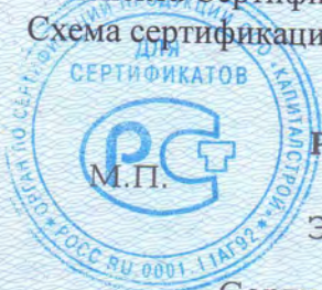
Схема сертификации: 2.

Руководитель органа (заместитель руководителя)